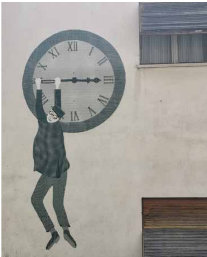
Pesariis, Carnia, paese degli orologi

ra di essere ingannati, che ci fa dare credibilità a chi condivide i nostri valori.