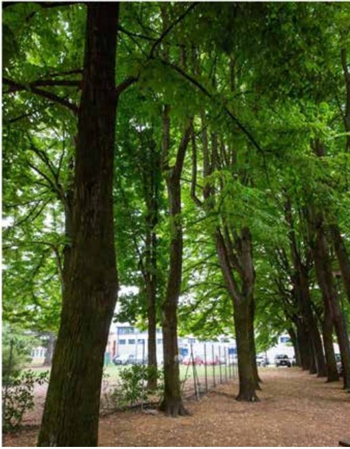
(vista dei Tigli prima dell'abbattimento e vista della desolante spianata di segatura residuata)